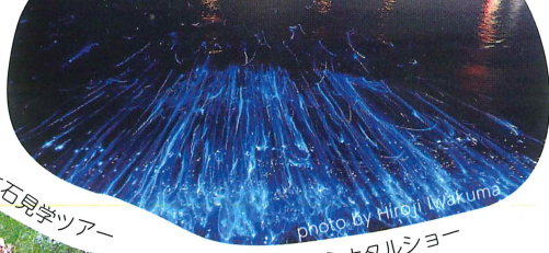
ウミホタルショー