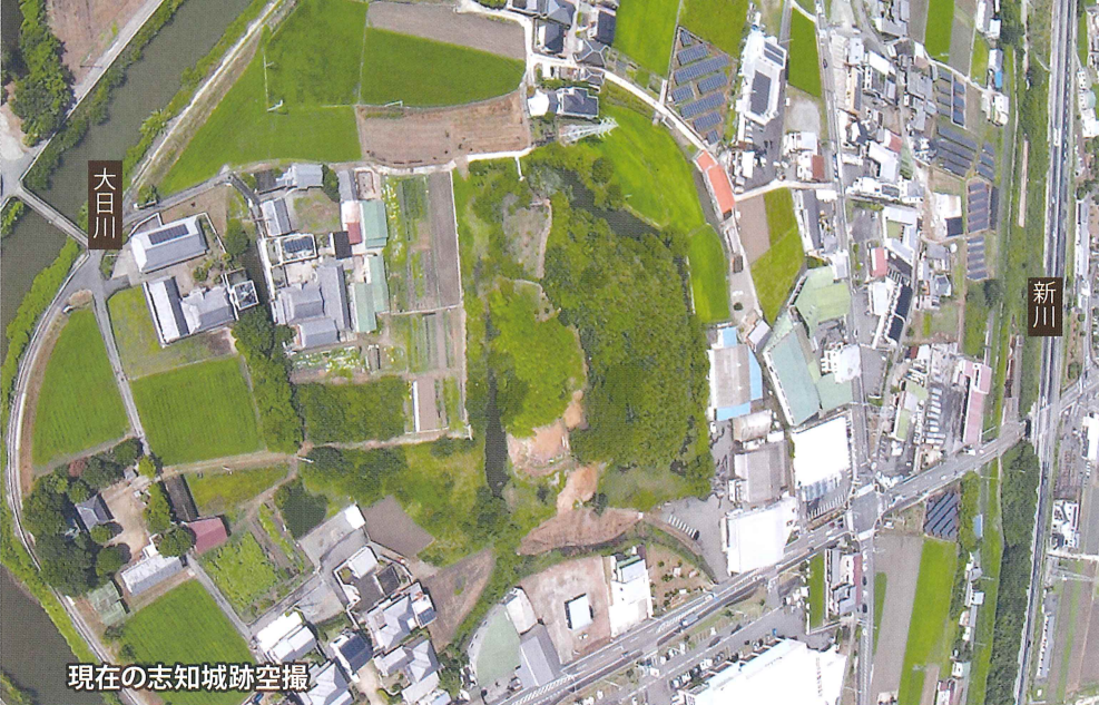
現在の志知城跡空撮

三原平野の一角にあり、松本城（旧三原町志知松本）とも呼ぶ。県道うずしおラインに近く、群生するアシに埋もれた堀に囲まれている。室町時代の養直館（旧三原町八木）、江戸時代の洲本城とともに築城法を知る重要な遺跡。