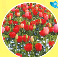
チューリップ 🕒 (3月中旬~4月中旬)