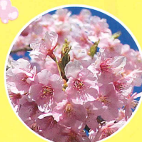
300品種の桜 🕒 開花時期 (2月下旬~4月下旬)