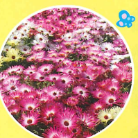
リビングストーンデージー 🕒 (4月中旬~5月中旬)