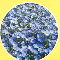
ネモフィラ 🕒 (4月中旬~5月上旬)